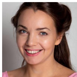
Дана Назарова Актриса театра Джигарханяна и игротерапевт