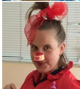
Анастасия Четверик (Актимальдина) Блестящая комическая актриса и клоунесса