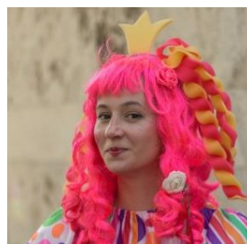
Екатерина Грошева – Великолепная принцесса и актриса